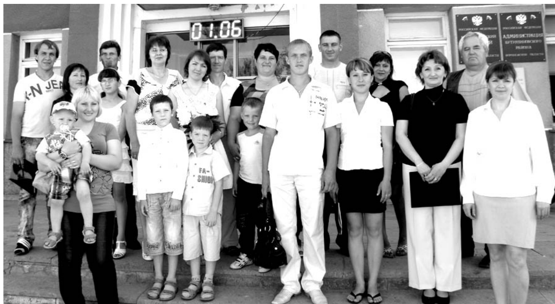
Трудиться на малой родине готовы.

В районе продолжается реализация мероприятий по улучшению жилищных условий граждан, проживающих в сельской местности, в рамках федеральной целевой программы «Социальное развитие села».