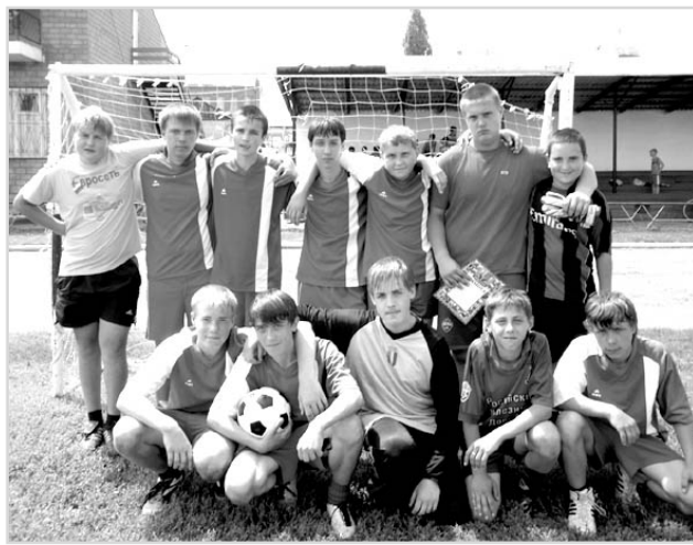
Нас сплотила игра.

31 мая был дан старт районному турниру по футболу на приз клуба "Кожаный мяч" сезона 2011 года.