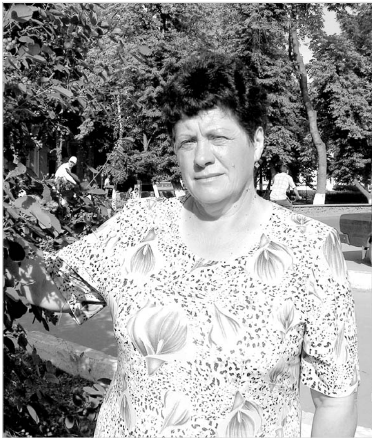
- Работу свою считаю нужной.

Чтобы успешно работать с пожилыми людьми, социальному работнику нужно знать их социально-экономическое положение, особенности характера, материальные и духовные потребности, состояние здоровья.