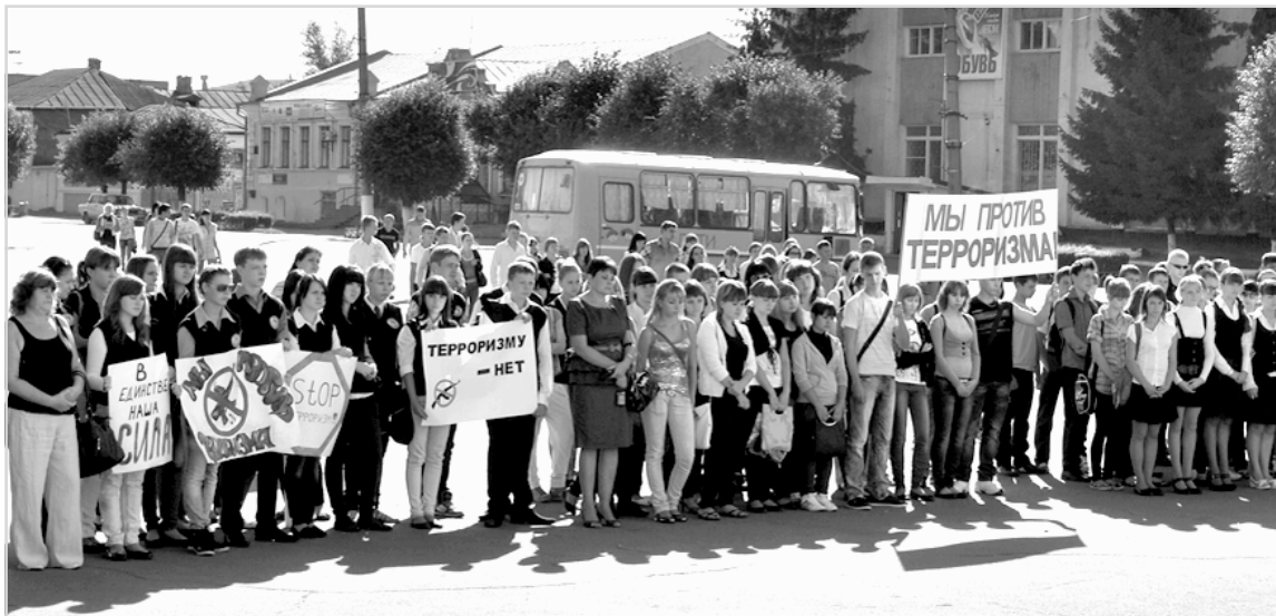
Забывать не вправе.

3 сентября в Бутурлиновке прошёл митинг, посвящённый памяти жертв Бесланской трагедии.