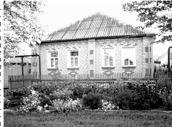
Самая благоухоющая клумба.

Александр САНИН.