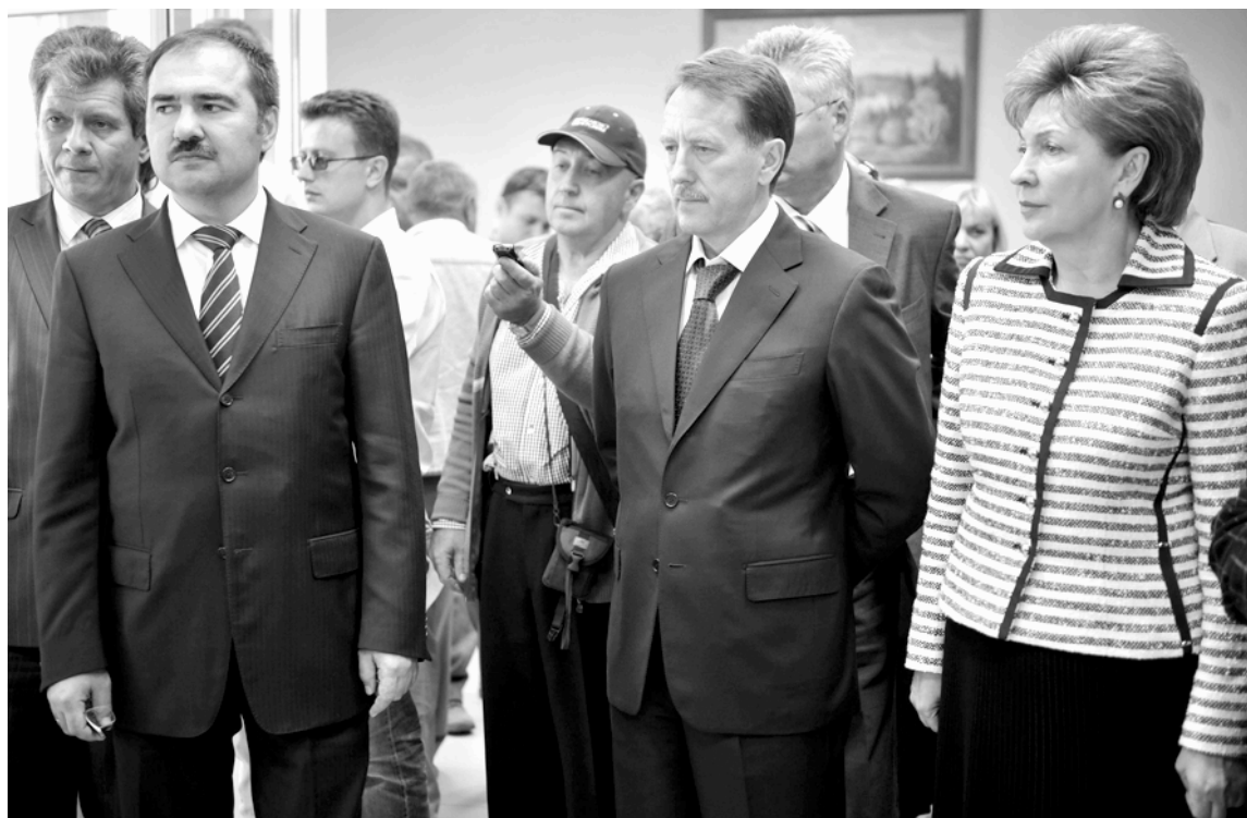
Во время рабочей поездки.

бернатор также вручил Почетные грамоты Правительства Воронежской области строителям, которые закончили объект в срок, качественно выполнив свою работу. «Это действительно пилот-