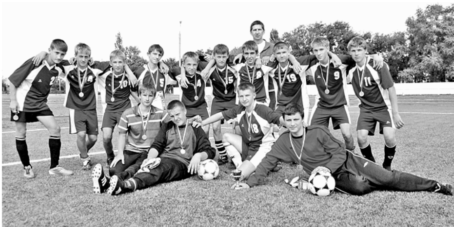
Каждая игра - праздник.

В Новохоперске 26 августа состоялись итоговые мероприятия, посвященные закрытию футбольного сезона 2011 года межрайонного турнира «Восточный регион».