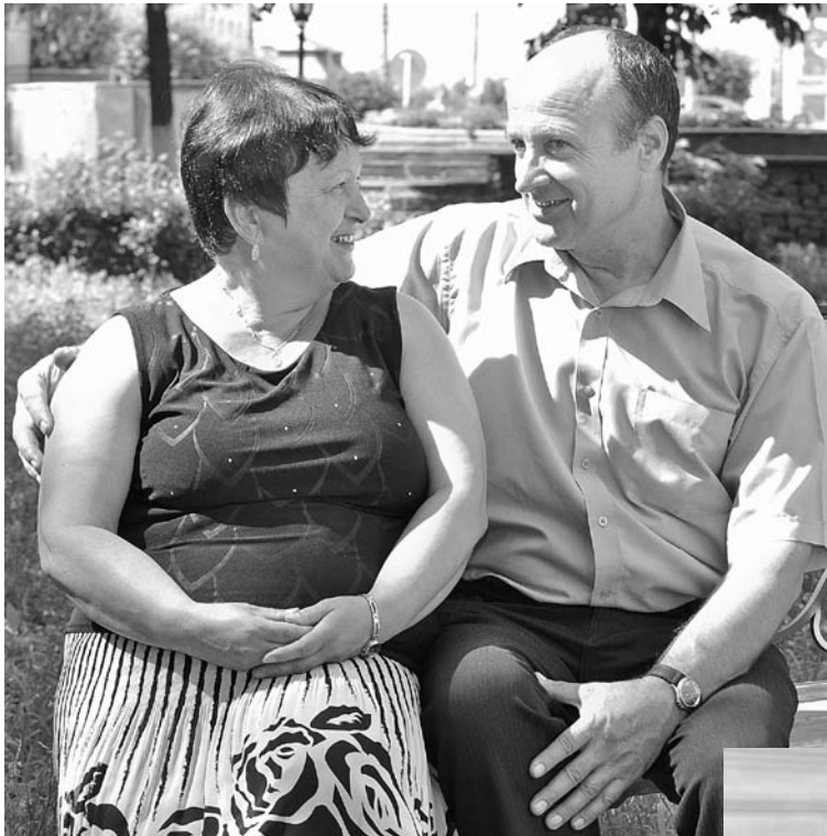
Сохранить глубину чувств.

Русь православная издавна славилась крепостью семей, живущих по Заповедям Господним. Многовековые традиции, прошедшие испытания временем, влиянием культур других народов и национальностей, все-таки и сейчас лежат в основе союза мужчины и женщины, где верность, любовь, терпение, всепрощение являются главной опорой.