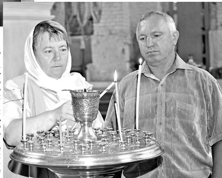
В любви и гармонии.

Этим двум супружеским парам в День семьи любви и верности будут вручены медали "За любовь и верность".