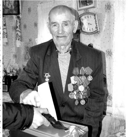
- За счастье детей и внуков.