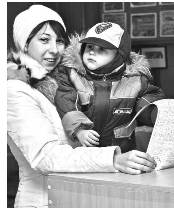
Голосую вместе с мамой.