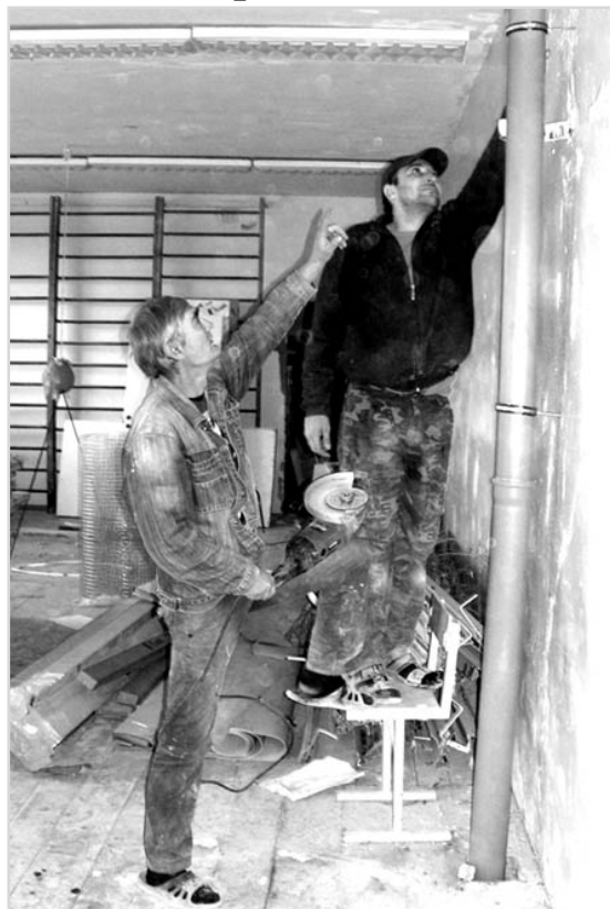
- А ну-ка крепёж проверь!

Полным ходом ведётся капитальный ремонт здания, предназначенного для детского сада №11.