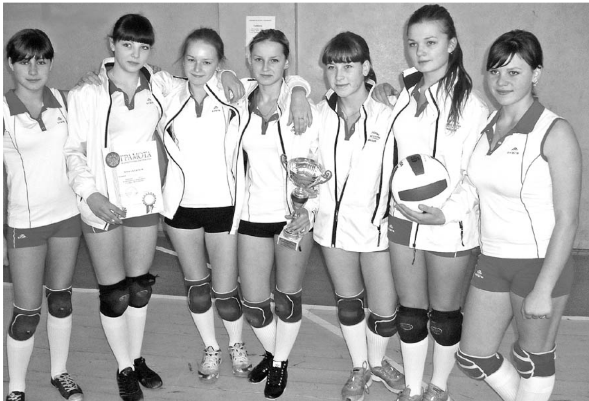
И спортсменки, и красавицы.

В спортивном зале профессионального лицея №39 в конце ноября прошли соревнования по волейболу на кубок Бутурлиновки.