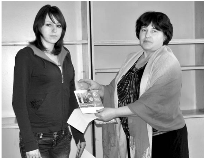
Причастность к важному делу.

Глава ЦИК Владимир Чуров, выступая перед журналистами, отметил, что выборы депутатов Государственной Думы Федерального Собрания Российской Федерации шестого созыва состоялись.