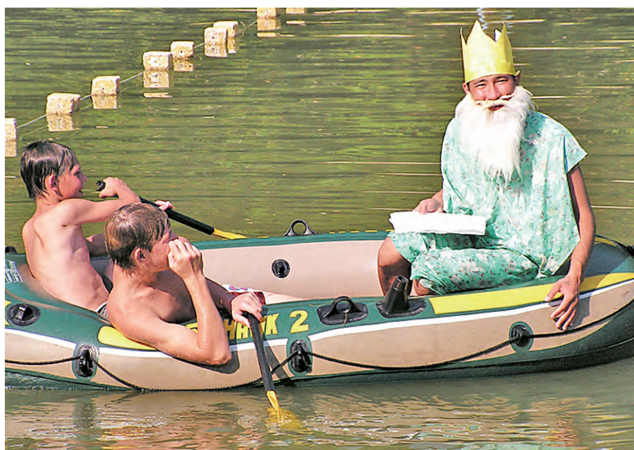
Царь морской на лодке надувной!

В детском оздоровительном лагере «Салют» состоялся праздник Нептуна, в котором приняли участие все пять отрядов, а это - почти 160 детей.