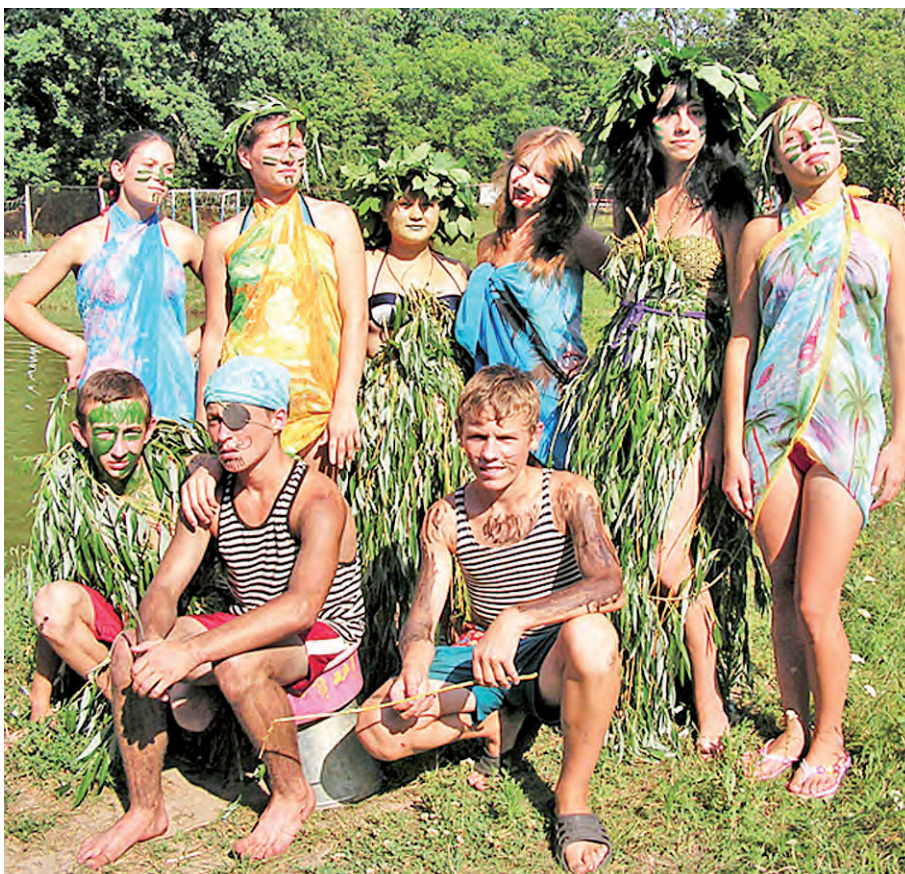
Неприступные кикиморы и страшные разбойники.