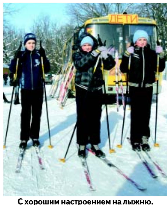
С хорошим настроением на лыжню.