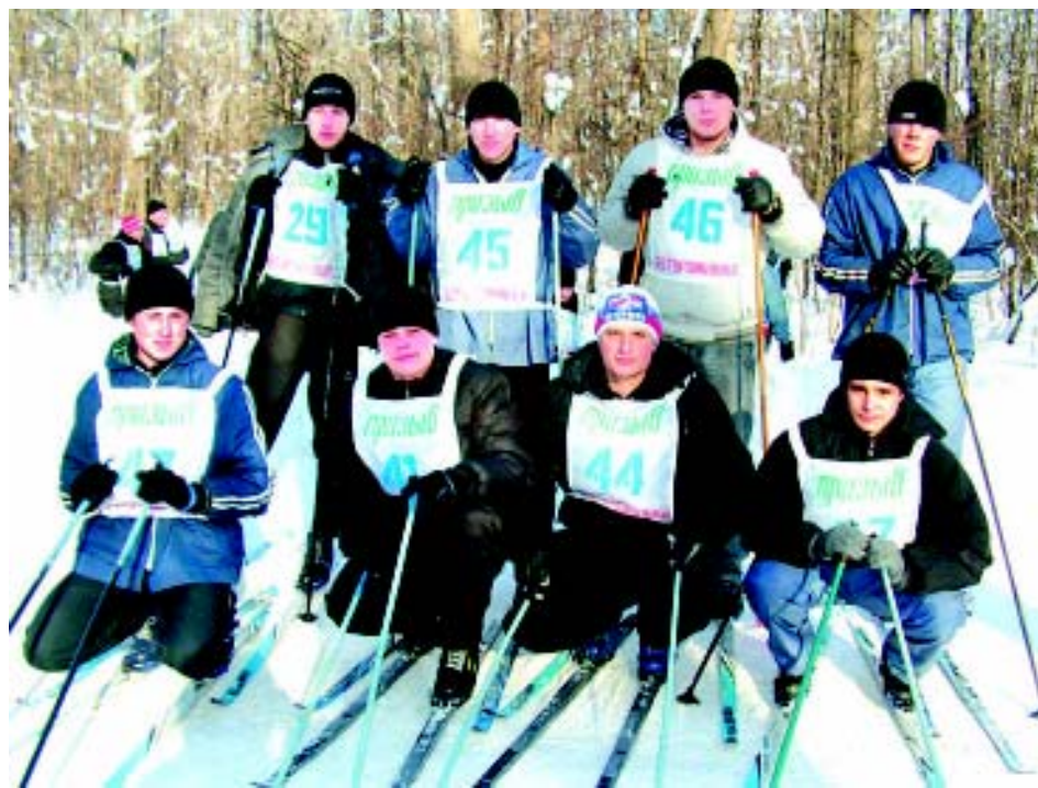
Читать - так читать, бежать - так бежать!

30 января одиннадцать любителей лыжных соревнований получили бесплатную подписку на районную газету «Призыв».