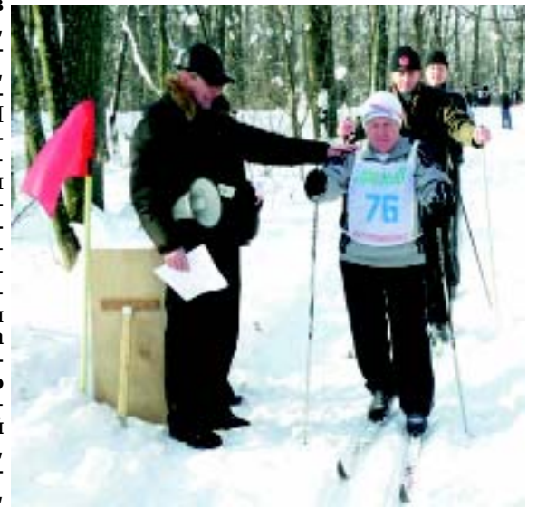
Вперёд! К победе!

А победителям соревнований этого года по традиции редакция газеты "Призыв" дарит подписку своего изда-