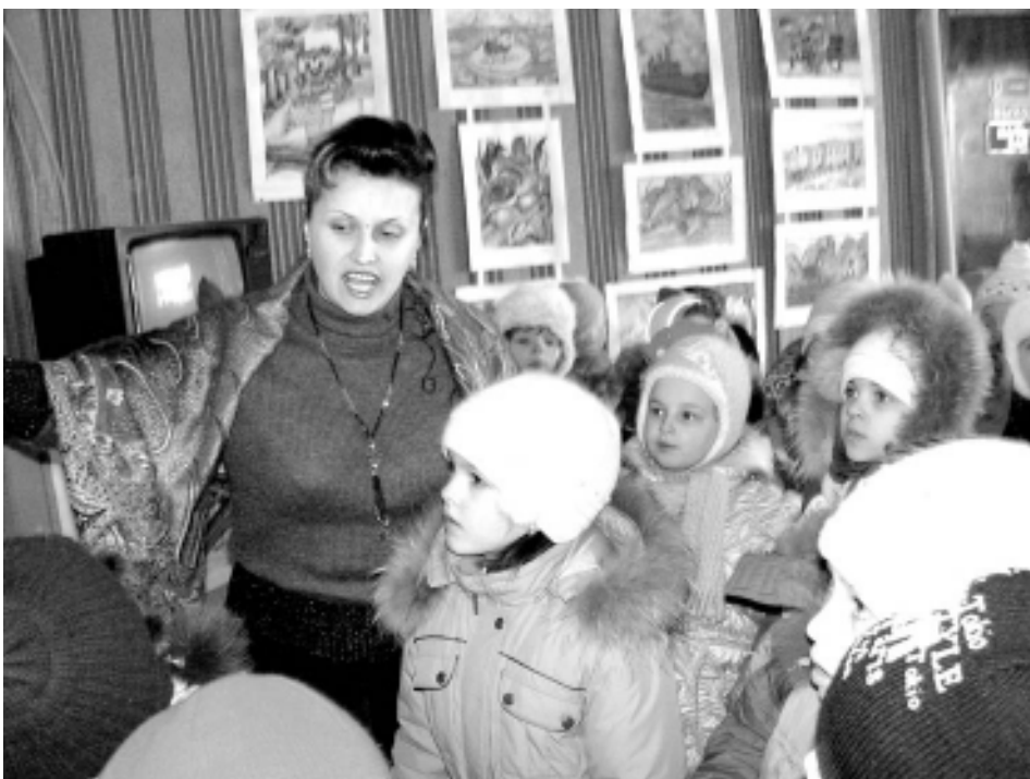
Малышам - о прекрасном.