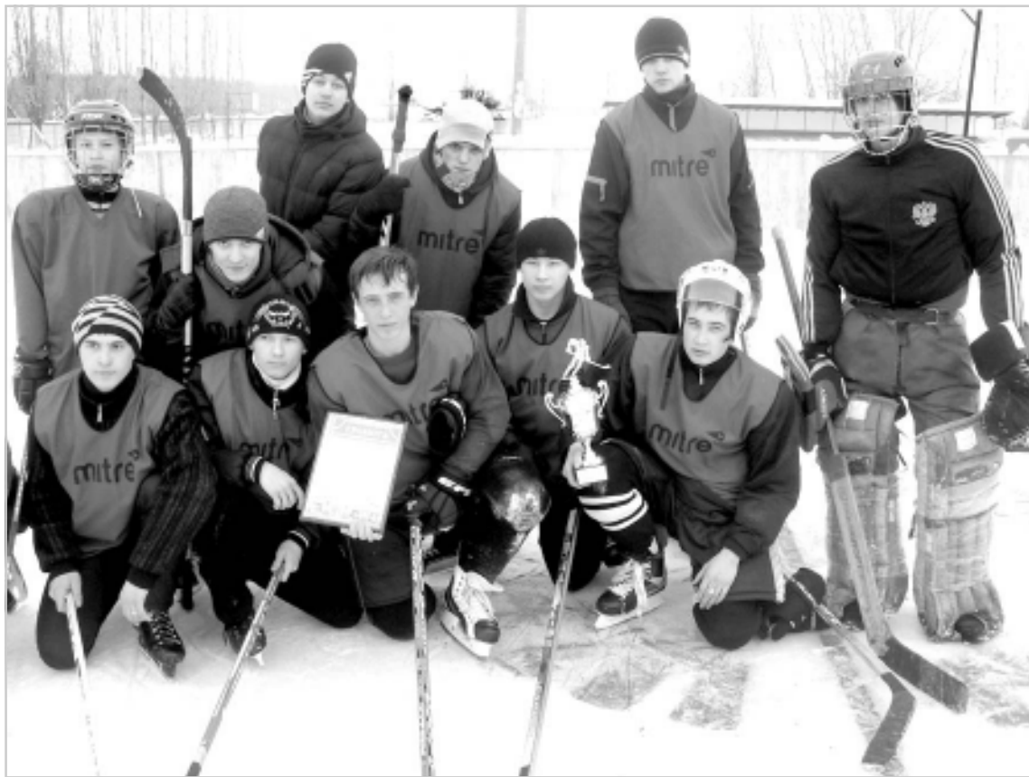
В хоккей играют настоящие мужчины.

Зимние игры - активный отдых для молодежи.