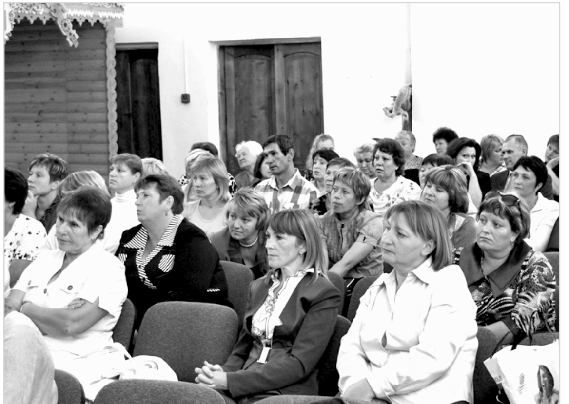
Во время обсуждения важного документа.

26 августа в Бутурлиновке прошло районное педагогическое совещание на тему «Законодательное обеспечение системы образования в условиях модернизации».