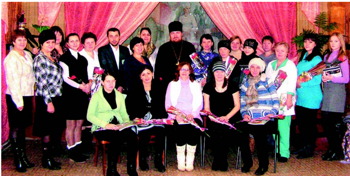
Участникам встречи - признание и цветы.

В середине ноября в МУЗ «Бутурлиновская ЦРБ», состоялось праздничное мероприятие, посвященное чествованию будущих мам.