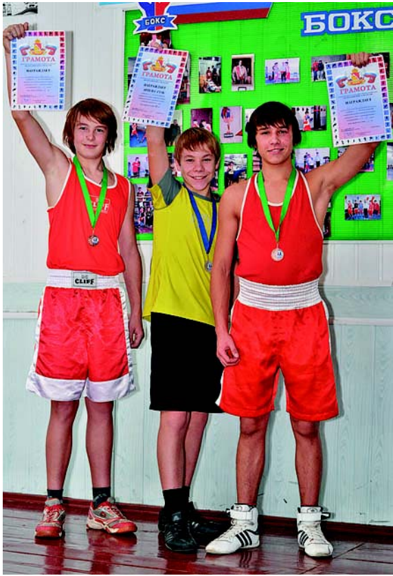
Успехи в спорте - хорошее настроение.

Боксёры спортивного клуба «Дружба» вернулись из областного центра с очередными наградами.