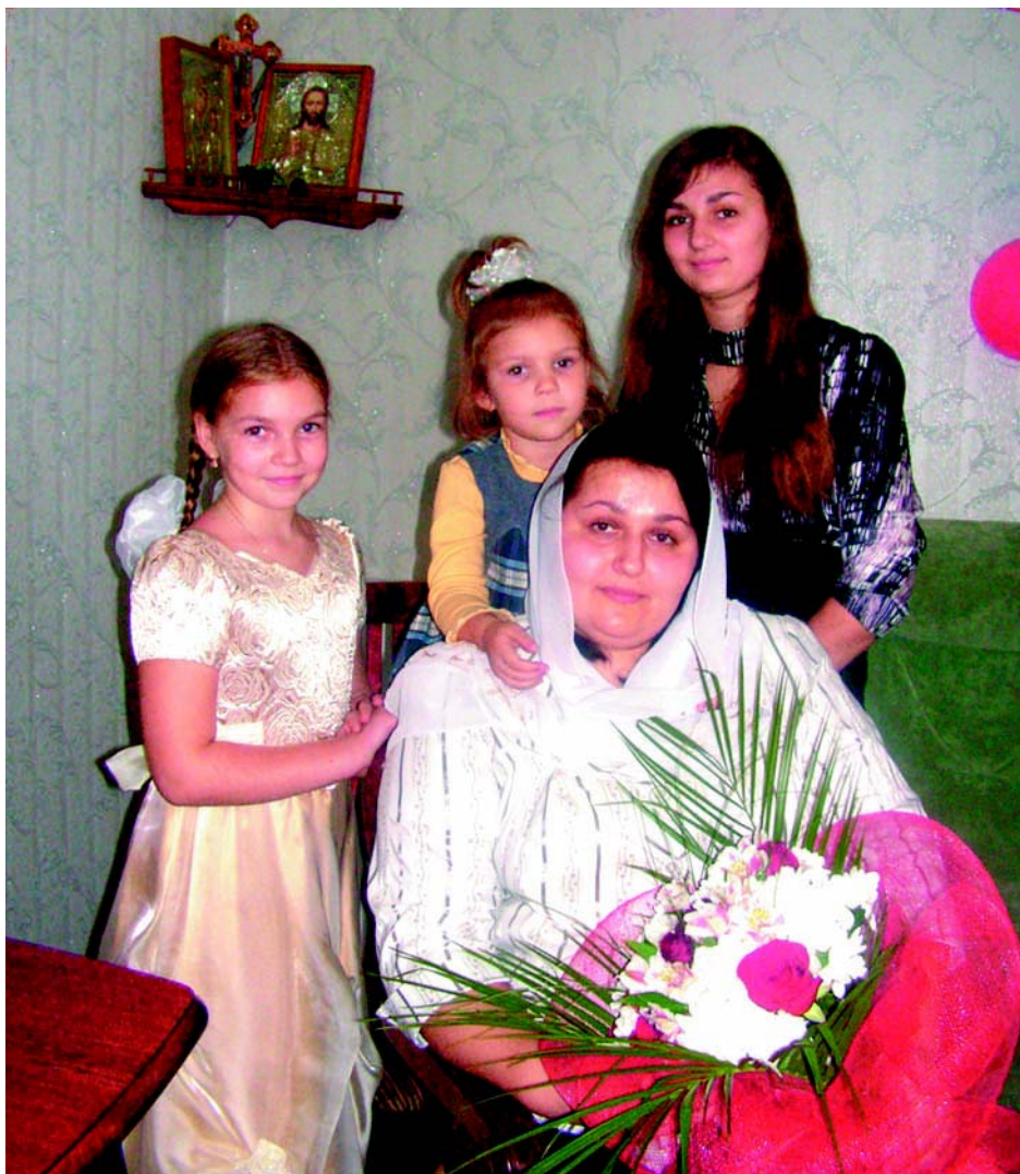
Счастье матери в детях.

Согласно статусу жены священника, ее уже 15 лет величают не иначе, как "матушка".