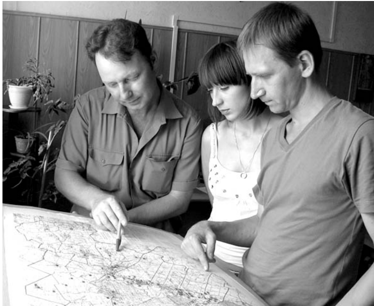
В каждом селе есть памятники.

Поисковики из Воронежского объединения «Дон» пытаются найти места захоронения итальянских солдат в Бутурлиновском районе.