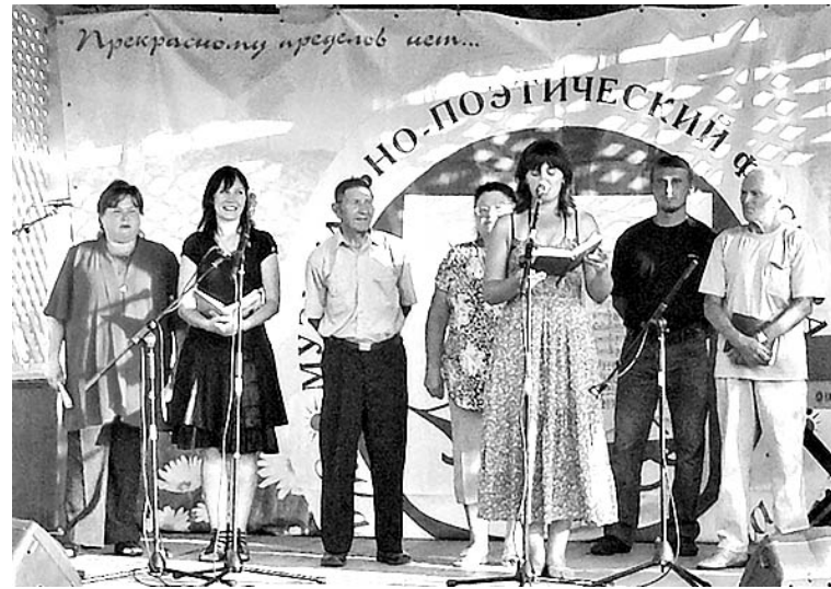
Их объединяет творчество.