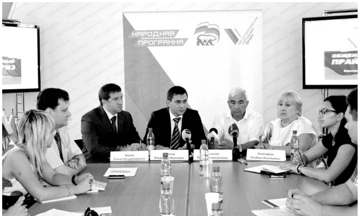
Принимать во внимание конструктивные идеи.

В Воронежской области стартуют предварительные первичные выборы, в ходе которых выдвигаются кандидаты в депутаты Госдумы от «Единой России».