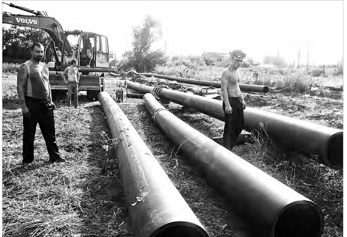
Чтобы была питьевая вода.

В нашем городе началось строительство комплекса водопроводных сооружений производительностью 3500 куб. метров в сутки. Стоимость работ составляет 125 826 227,40 руб.