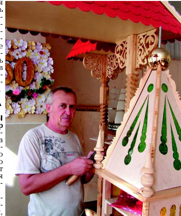
Резных дел мастер.

На что ни посмотрит мастер - все может изготовить, было бы только время.