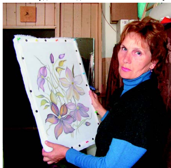
Батик почти готов.

Вот где виден размах, полет мысли. Спектакли, праздники, концерты, торжественные заседания - все продумывает художник до мело-