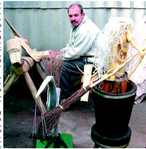
Игрушки из-под топора.