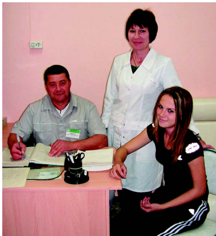
- Я осмотра не боюсь.

О выявленных патологиях немедленно информируют областных специалистов по профилю заболевания, которые прокон-