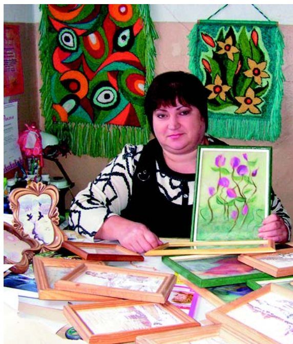
В каждой работе - природа.