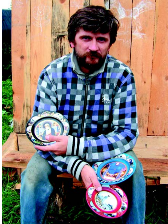
Тарелки-то не летающие!