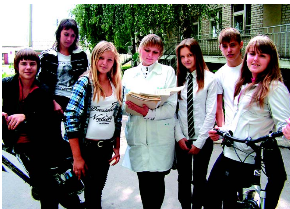
- А в кабинет пойдете по списку.