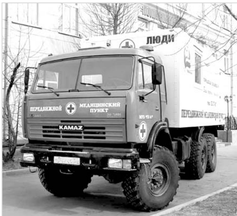
Передвижной флюорограф - к услугам населения.

Заразиться можно в любом месте (в общественном транспорте, в кинотеатре, магазинах и т.д.). Возможен путь заражения через пищевые продукты,