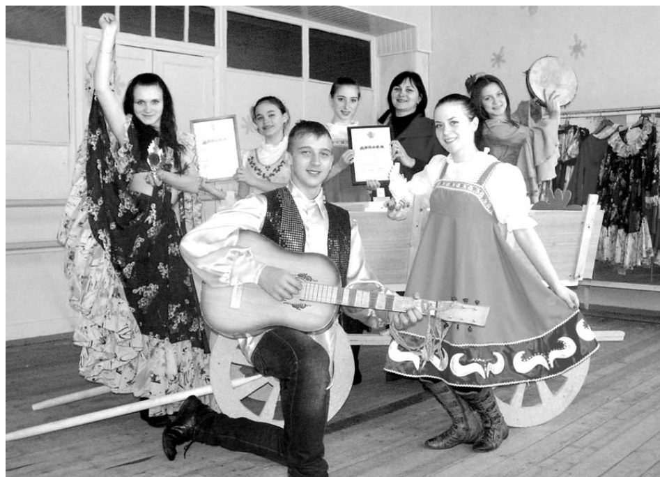
На репетициях трудиться - награды добиваться.

Хореографический ансамбль "Золушка" стал лучшим среди восьми районов области.