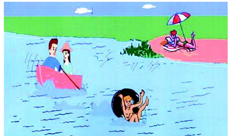
Соблюдай правила поведения на воде.