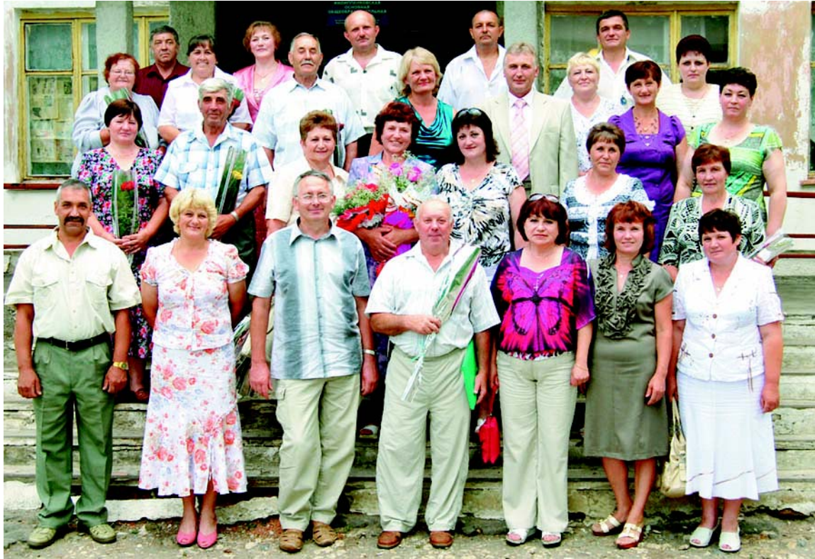
И вот уже зовут по отчеству...

В конце июня в Филиппенковской школе состоялась встреча выпускников.