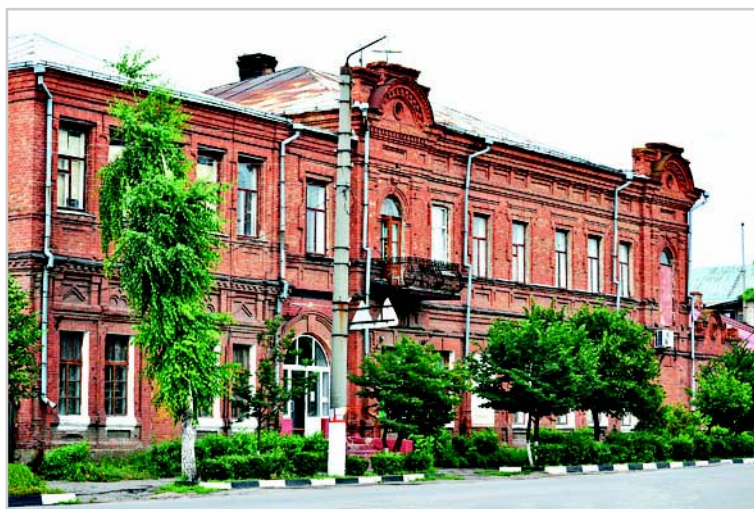
Бутурлиновка. Педучилище. 2011г.

Сколько познавательного несут в себе письма, документы тех далеких лет! Странным образом из рукописей «явились» к нам в глубинку люди, которые творили историю, люди из прошлой России, России с интересной судьбой, той России, в которую мы верим и которую любим.