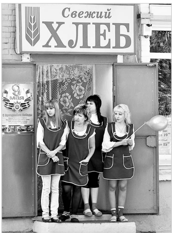
Хлеб нужен ежедневно.

Роскошная зелень озимых стелется по земле, обещая богатый урожай. Нельзя сказать, что мы в течение года ощутили недостаток в хлебе. В потребительской корзине он продолжа-