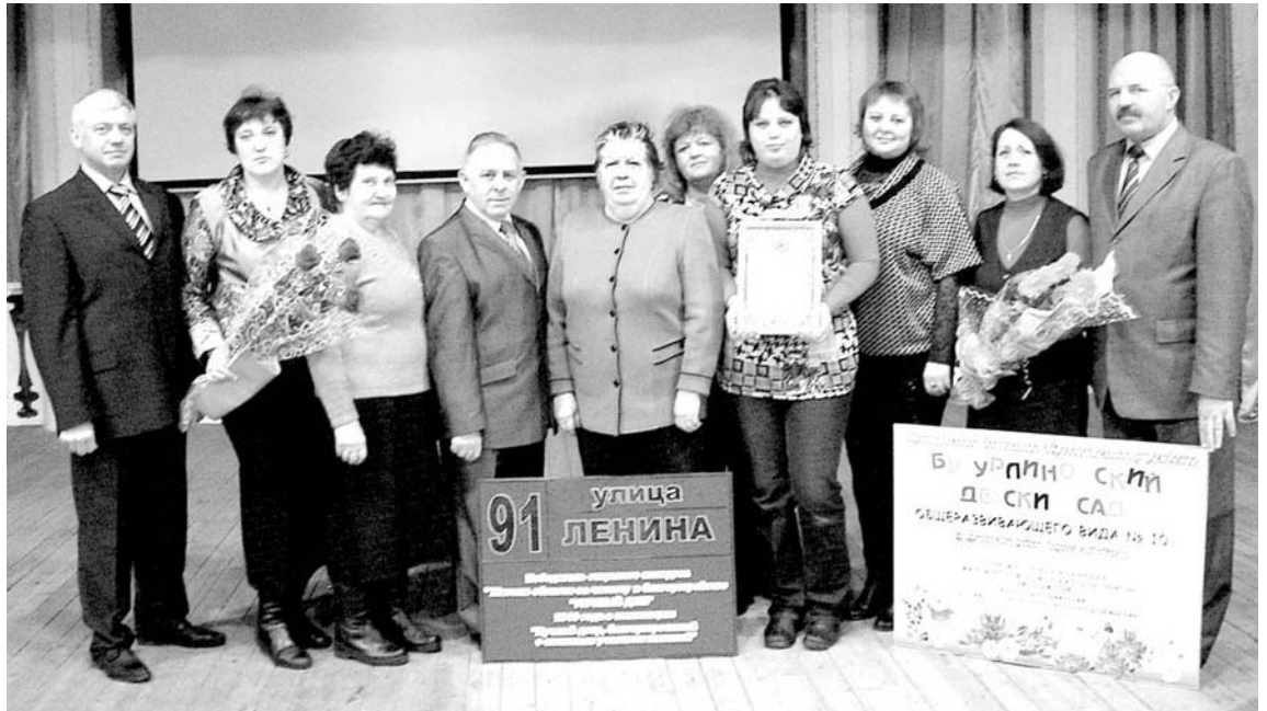
По труду и честь.

Узнав, что в области объявлен конкурс на лучший дом, двор, улицу, детское дошкольное и школьное учреждение, самыми первыми включился в него жильцы дома №91 по ул. Ленина и детский сад №10.