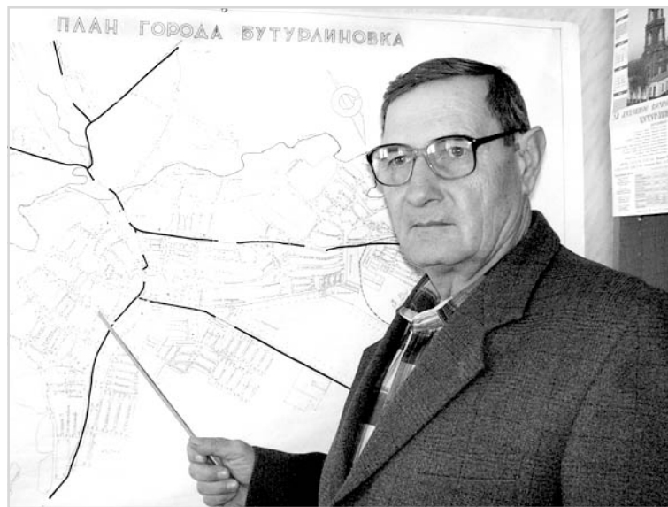
У схемы теплоцентралей.

Теплосеть - сезонная организация: полгода ведет круглосуточные вахты по отоплению жилья, а полгода - ремонтирует теплотрассу. 77 человек в сезон насчитывает среднесписочный состав работников предприятия. Это грамотные люди, которые несут большую от-