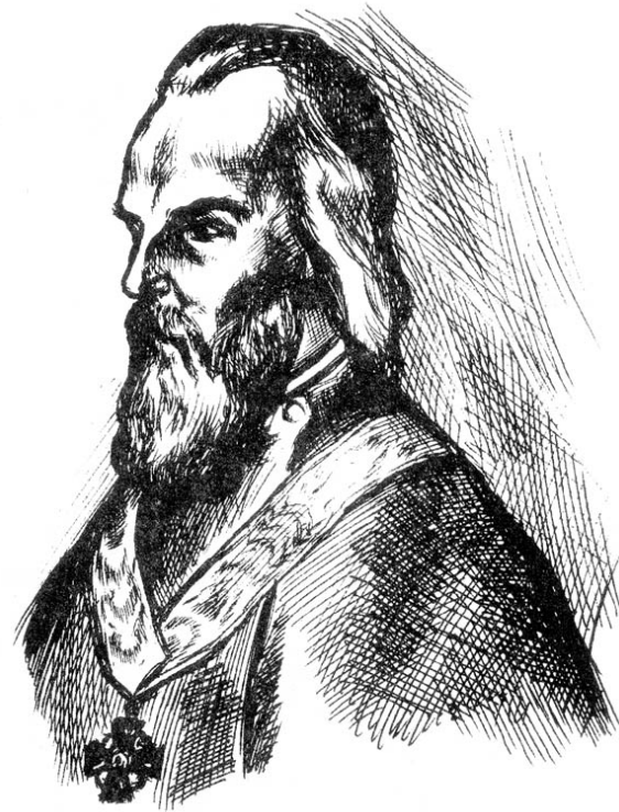
Андрей Стефанович Соболев (Рисунок Андрея Закутского ).

нему с почтением и уважением. Трудами вчерашнего семинариста, часто мучимого физическими недугами, Православная вера одерживала верх над инославными конфессиями в маленьком уголке Воронежской губернии.