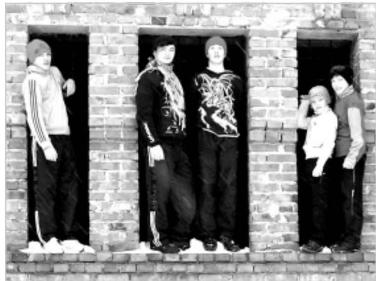
«DILOS» - за здоровый образ жизни.

Паркур - молодежное спортивное движение, представляющее собой совокупность навыков владения своим телом. Трейсеры называют людей, занимающихся паркуром.