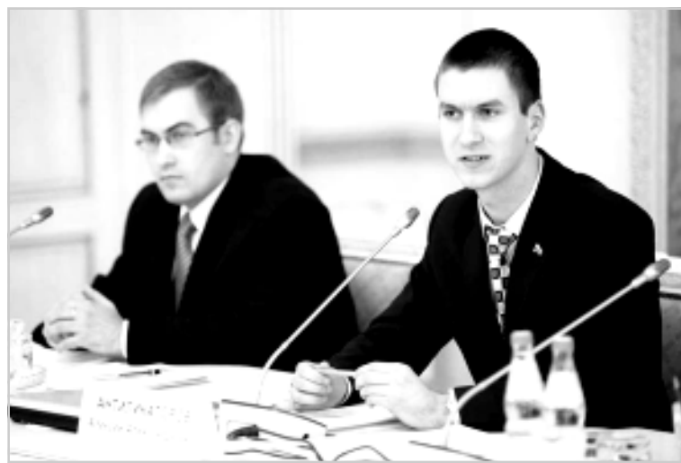
В будущее - без алкоголя и наркотиков.

- Нам необходимо настроить на дальнейшую конструктивную работу. Нужно, чтобы все неравнодушные люди поверили в собственные силы и увидели, что мы идем к общей цели. При этом важно не только сформировать ценности, но и сделать так, чтобы каждый человек смолоду понимал: он является главной ценностью государства, - подвел итоги форума губернатор Алексей Гордеев.