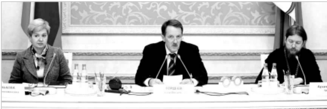
Воронежская область - локомотив проекта.

В начале февраля в Доме областного правительства под председательством губернатора Алексея Гордеева прошел II-ой форум общественного движения «Наше общее дело», деятельность которого направлена на борьбу с алкоголизмом и наркоманией.