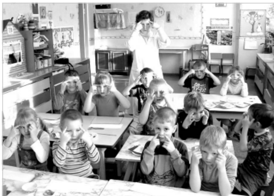
Точечный массаж здоровья.

В детском саду №11 работают люди, преданные своему делу всем сердцем и душой.